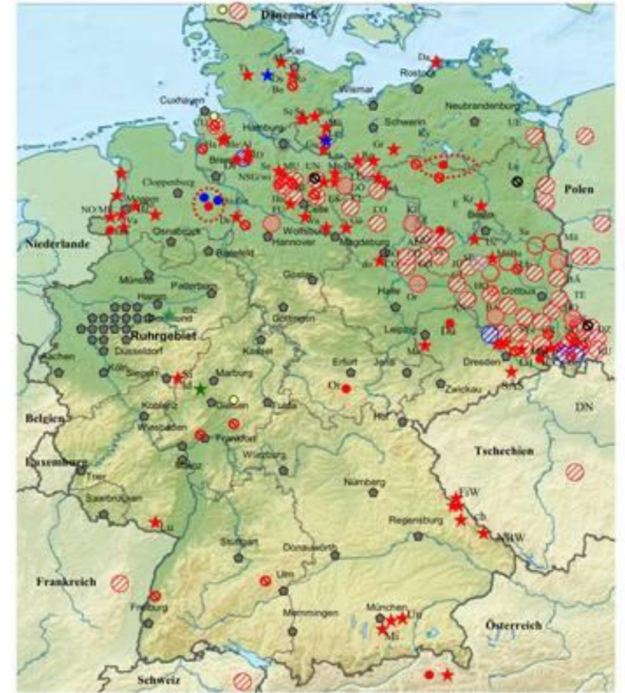
Wolfverbreitung in Deutschland 2015/2016 – Stand 06.01.2016